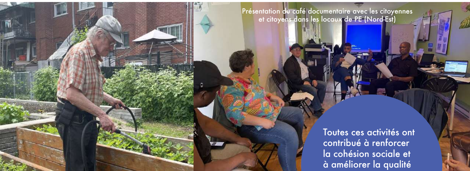
Présentation du café documentaire avec les citoyennes et citoyens dans les locaux de PE (Nord-Est)

Plusieurs rencontres de Greg-o-miel ont eu lieu pour la relance d'apiculture sur le toit. Le groupe a acheté une nouvelle colonie d'abeilles pour produire du miel, et a aménagé le toit pour la récolte au courant de l'été.