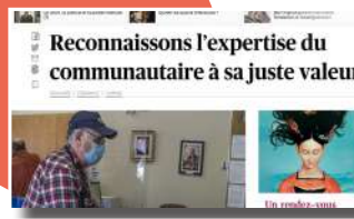
Reconnaissons l'expertise du communautaire à sa juste valeur , Le Devoir, septembre 2022