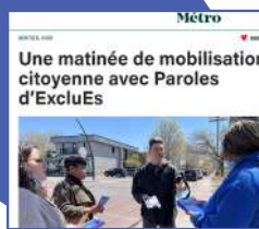
Une matinée de mobilisation citoyenne avec Parole d'excluEs , Journal Métro, mai 2022