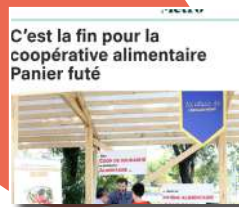
C'est la fin pour la coopérative alimentaire Panier futé , Journal Métro, mai 2022