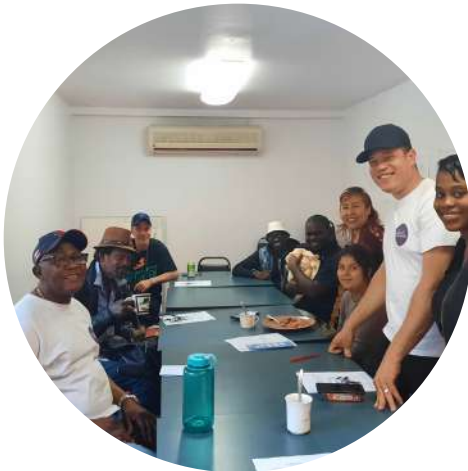
Comité Voisins Vigilants