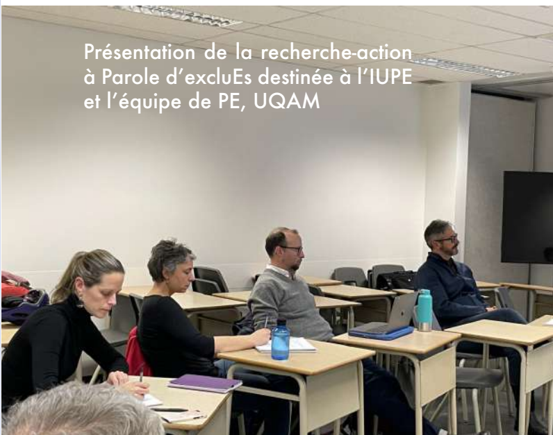
Présentation de la recherche-action à Parole d'excluEs destinée à l'IUPE et l'équipe de PE, UQAM

Nous vous invitons à visiter le blogue de l'IUPE pour connaître l'ensemble des publications de l'année 2022 www.iupe.com