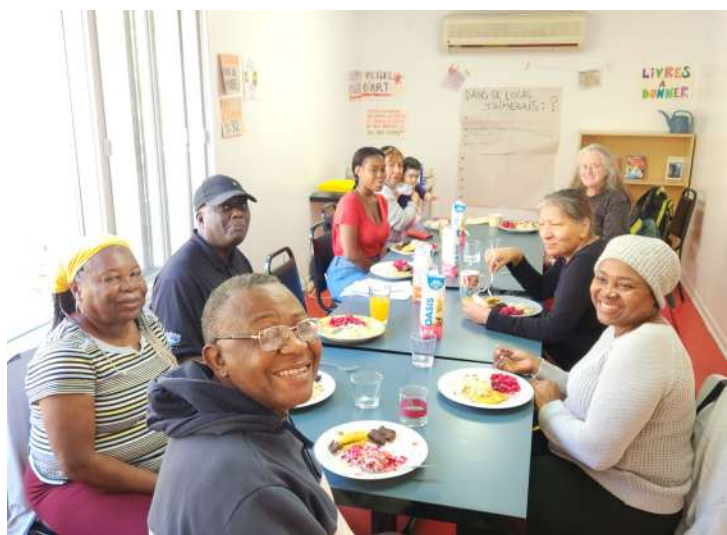
Rencontre des citoyennes et citoyens lors d'une activité de cuisine autour du monde dans les locaux de PE (îlot Pelletier)

Cette initiative permet de se rassembler et d'interagir en échangeant sur les différentes cultures et traditions culinaires. Au-delà de la simple préparation et de la dégustation de plats, cette activité renforce les liens sociaux entre les membres de la communauté et un sentiment d'appartenance et de solidarité. Les échanges interculturels ont également permis de sensibiliser les participantes et participants aux différentes perspectives et aux modes de vie des autres personnes de la communauté, renforçant ainsi la compréhension et le respect mutuels.