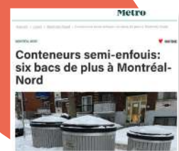
Conteneurs de plus semi-enfouis : six bacs de plus à Montréal-Nord , Journal Métro, janvier 2022

Série de reportages sur les îlots de chaleur, présentation La voisinerie , CBC, juillet 2022