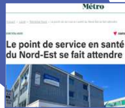
Le point de service en santé du Nord-Est se fait attendre , Journal Métro, juillet 2022