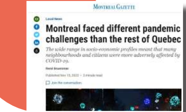
Montréal a fait face à des défis pandémiques différents de ceux du reste du Québec , Montréal Gazette, 15 novembre 2022

Point de santé en attente, entrevue radio, Olivier Bonnet , CBC, juillet 2022