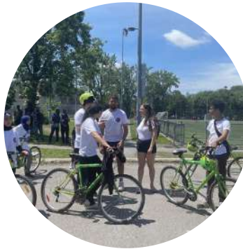
Comité Gilets Verts