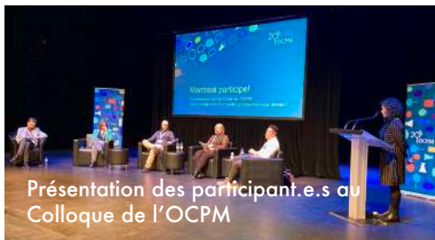
Présentation des participant.e.s au Colloque de l'OCPM

Dans le cadre du colloque organisé pour les 20 ans de l'OCPM, nous avons participé à un atelier intitulé Multiplier les espaces de participation pour inclure plus de citoyens : quelles leçons et quels défis pour la consultation publique? pour présenter l'approche de la mobilisation citoyenne à Parole d'excluEs. Cette rencontre a été présentée en octobre devant plus d'une centaine de personnes invitées et participantes.