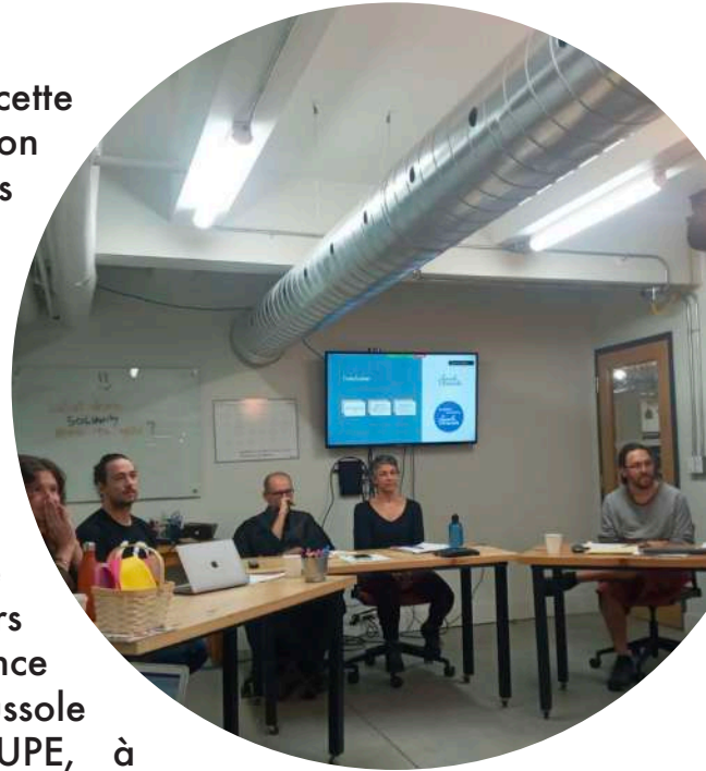
Photo : Présentation IUPE au 4 e colloque annuel du CRITS, Ottawa

Cette étude a donné lieu à une première présentation de la cartographie de la littérature lors d'une rencontre de l'IUPE à l'UQAM; une séance de co-analyse et de co-construction de la boussole de la justice épistémique, dans le cadre de l'IUPE, à l'UQAM; les résultats préliminaires ont été présentés par le coordonnateur de la recherche-action au 4 e colloque annuel du CRITS novembre, à Ottawa, lors d'une présentation intitulée La justice épistémique mise en pratique : retour sur une expérience de croisement des savoirs . Les résultats préliminaires de cette recherche ont aussi été publiés dans la revue Perfectio , dans un article "Partir de la parole citoyenne dans un organisme communautaire : les réussites et les défis de la mise en pratique de la justice épistémique" (automne 2022, pages 22-25).