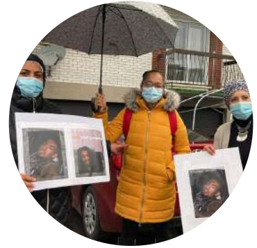
Comité Maman contre la violence