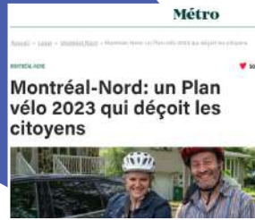
Montréal-Nord : un Plan vélo 2023 qui déçoit les citoyens , Journal Métro, octobre 2022

Durant l'année, Parole d'excluEs s'est positionné sur différentes thématiques et divers enjeux à travers des interventions dans les médias locaux et nationaux.