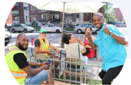
Comité Staff Lapierre